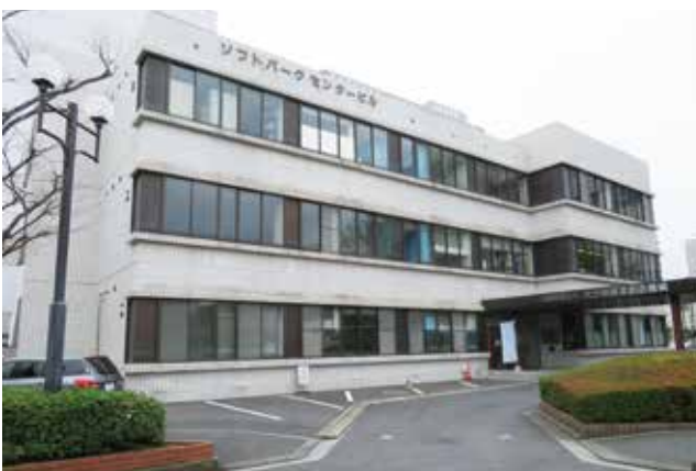
公益財団法人 大分県産業創造機構

TEL 097-533-0220 http://www.columbus.or.jp/