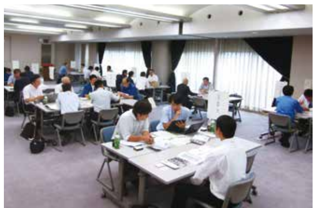
おんせん県モノづくり商談会