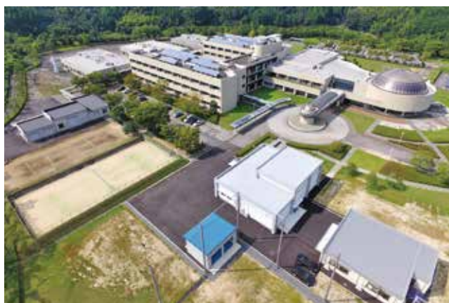
大分県産業科学技術センター

大分市高江西1丁目4361-10(大分インテリジェントタウン内) TEL 097-596-7101 http://www.oita-ri.jp/