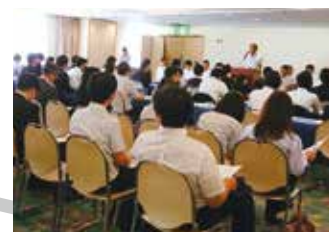
おおいた夏の就職フェア