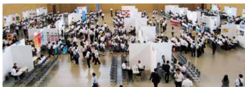
元気おおいた就職ガイダンス(高校生向け合同企業説明会)